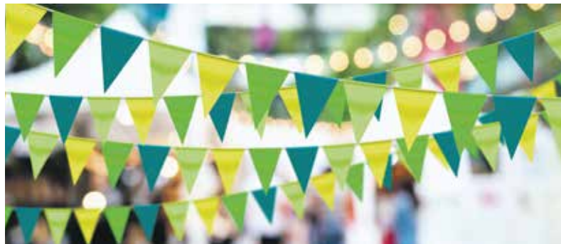
Die Pro Senectute Kanton Schaffhausen feiert mit der Bevölkerung Geburtstag.