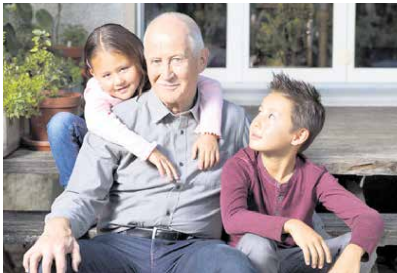
Pro Senectute schafft Berührungspunkte zwischen Alt und Jung.

Die Dienstleistungen von Pro Senectute sind – analog zu den Bedürfnissen der älteren Bevölkerung – in ständigem Wandel begriffen. Unser Angebot ist lokal verankert und bedarfsgerecht, der Zugang zu den Dienstleistungen niederschwellig. Heute ist Pro Senectute