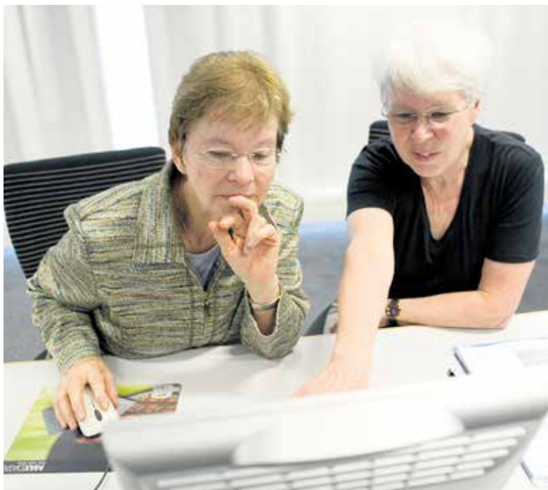
Weiterbildung und Wissen kennen keine Altersgrenzen.

Eine der Chancen ist das grosse Know-how der älteren Generation. Viele Menschen möchten sich nach der Pensionierung in einer dritten Karriere als Freiwillige oder im Sozial-