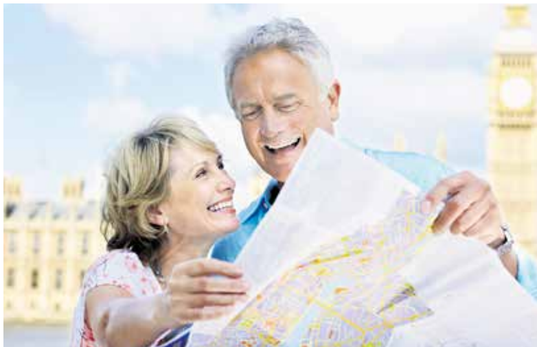
Persönliche Angelegenheiten sollten zu Lebzeiten geregelt werden.