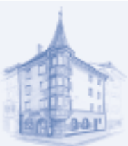
VOLKSAPOTHEKE ZUM ROTEN OCHSEN