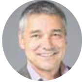
Walter Vogelsanger Departement des Innern Regierungsrat Schaffhausen

Im Namen der Schaffhauser Regierung gratuliere ich der Stiftung Pro Senectute zum 100-jährigen Bestehen. Ein stolzes Alter! Im Vergleich dazu werden heute die Frauen im Mittel 84,5 und die Männer 80,1 Jahre alt. Tendenz steigend. Als ich zur Welt kam, lag die Lebenserwartung erst bei 71,2 Jahren. Heute, rund 50 Jahre später, liegt sie schon bei 82,3 Jahren. Geht das so weiter, liegt die Lebenserwartung im Jahr 2090 bei 100 Jahren. Haben wir diese offensichtlich immer günstigeren Lebensbedingungen Pro Senectute zu verdanken? Der Stiftung, die ihr Programm im Namen trägt: Pro Senectute, für das Alter?