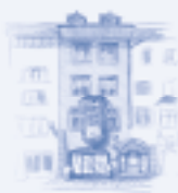
VOLKSAPOTHEKE ZUM ZITRONENBAUM