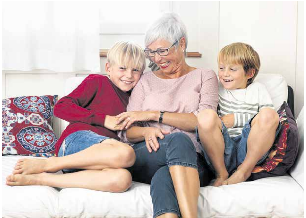
Die Begegnung und gegenseitige Anerkennung zwischen Angehörigen fördern das Verständnis der Generationen.

1970 Bezug der neuen Sekretariats- beziehungsweise Beratungsstelle auf dem