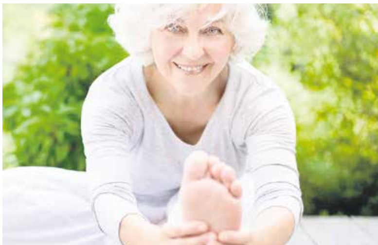
Pro Senectute unterstützt Ältere bei der Erhaltung ihrer Mobilität.

Mit dem zunehmenden Alter benötigen ältere Menschen Unterstützung im Alltag (einkaufen, waschen, putzen, Transporte). Ein Grossteil dieser Aufgaben wird heute unentgeltlich durch Angehörige geleistet. Die Angehörigenhilfe kommt jedoch zunehmend unter Druck, da die Verfügbarkeit der Angehörigen zeitlich und räumlich abnimmt (kleinere Familien, Angehörige leben weit weg, gestiegener Prozentsatz von berufstätigen Frauen und so weiter). Pro Senectute stellt dank dem Engagement von zahlreichen Freiwilligen und im Sozialzeit-Engagement Tätigen