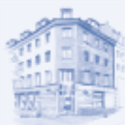
VOLKSAPOTHEKE ZUM RÜDTEN