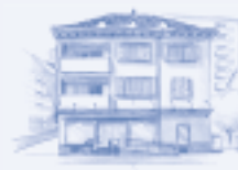
VOLKSAPOTHEKE IM DORF NEUHAUSEN