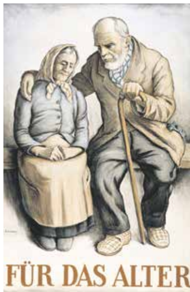
Plakate von Pro Senectute aus den 1930er-Jahren.

Bereits 1918 wurde im Kanton Schaffhausen eine «Filiale» dieser Stiftung gegründet und 1994 erlangte die Pro Senectute Kanton Schaffhausen die eigene Rechtspersönlichkeit. Der Zweck wird folgendermassen beschrieben: «Die Stiftung bezweckt, in ihrem Tätigkeitsgebiet die Selbständigkeit und das Selbstbewusstsein der älteren Menschen zu erhalten und zu stärken und sie im Rahmen des Möglichen zu befähigen, in allen Lebensfunktionen selbständig zu bleiben und ihnen die Kontinuität in den wichtigsten Lebensbereichen zu sichern.»